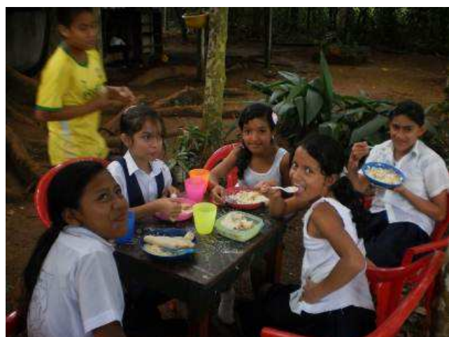
Nach einem Kochkurs die wohlverdiente Mahlzeit

Die achte Klasse besteht aus 16 Schülerinnen und Schülern, die siebte Klasse aus zwölf. Die beiden Grundschulklassen haben eine Klassenstärke von jeweils ungefähr 20