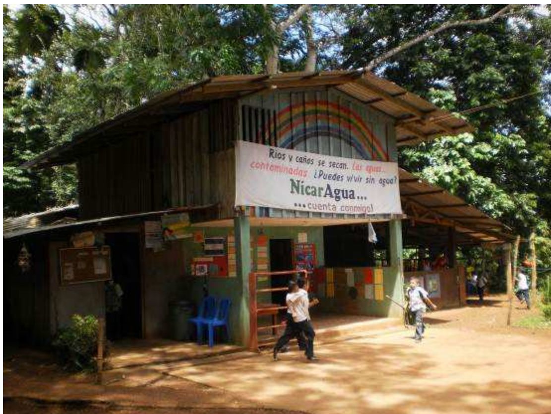
Die Montessorischule Jan Amos Comenius in Nueva Guinea