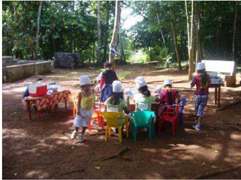
Vorschulunterricht im Freien

Im Vergleich zu staatlichen nicaraguanischen Schulen, in denen die Klassenstärke oft bei 30-40 Schülerinnen und Schülern liegt, kann die emJAC so eine viel persönlichere Beziehung zwischen der Lehrer- und Schülerschaft ermöglichen. Gerade diese Beziehungen, welche meine nicaraguanischen Kolleginnen und Kollegen zu ihren Klassen aufgebaut haben, empfinde ich als sehr bewundernswert.