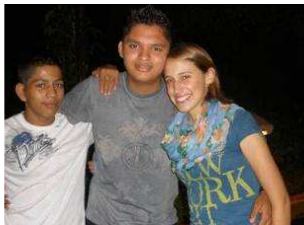
Schüler aus der 8. und 11. Klasse mit mir

Ich war und bin mir selbst noch nicht ganz sicher, was für eine „Lehrerrolle“ ich denn spielen will. In meiner Schulzeit habe ich selbst ja die verschiedensten „Lehrertypen“ kennen gelernt. Wie viel der Autorität bedarf es denn, um eine Klasse zu unterrichten? Und wie viel