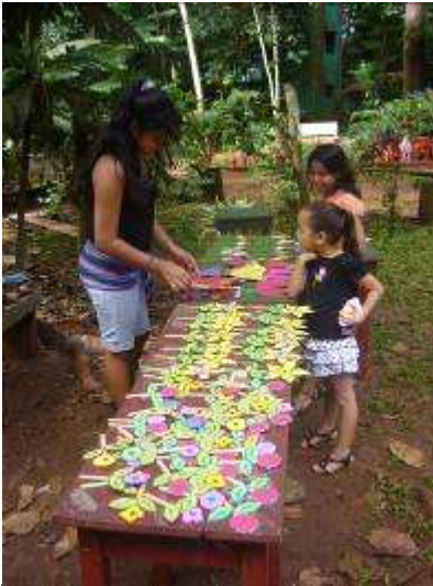
Gebasteltes aus dem Hand- arbeitsworkshop

unseren Fächern Religion und Ethik, Werte des Zusammenlebens vermittelt) und ECA „ Expresión Cultural y Artística “ (wörtlich: kultureller und künstlerischer Ausdruck; dies umfasst Tanz, Musik, Handarbeit und Kunst mit Schwerpunkt auf nationalen Traditionen).