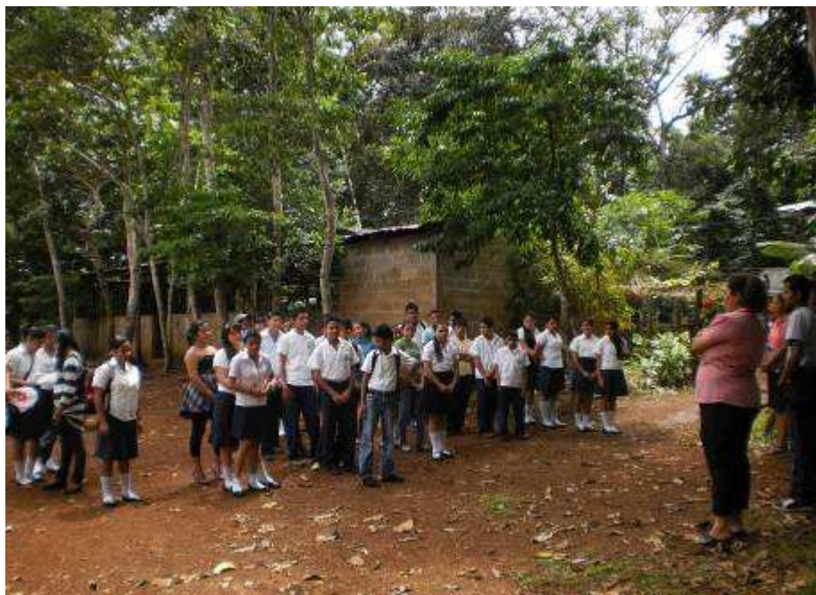
Montagsmorgens vor Schulbeginn: Aufstellen und Singen der Nationalhymne

Allerdings habe ich auch oft feststellen müssen, dass noch so gut geplante Stunden leider nicht immer bei meinen Schülerinnen und Schülern auf Gegenliebe stoßen. Frustrationen schneller wegzustecken, musste ich erst lernen und muss es auch immer noch.