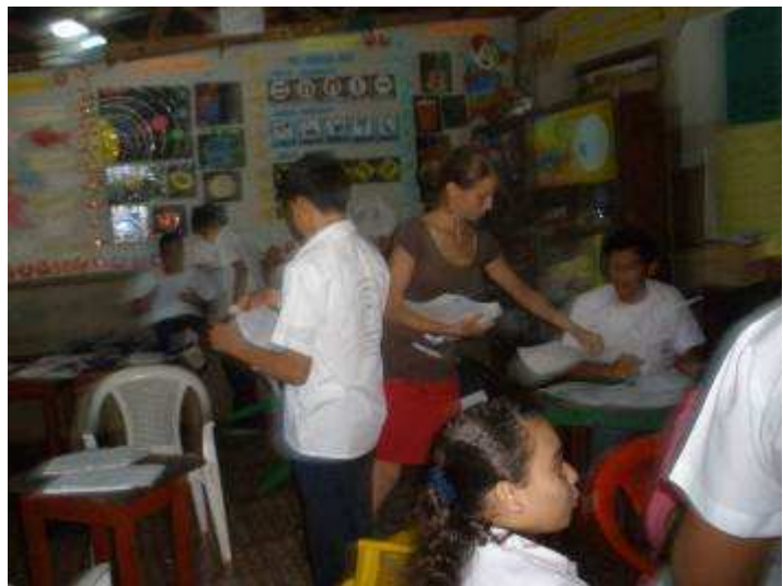
Rückgabe einer Klassenarbeit

Ich hatte in keiner Weise eine Ahnung davon, wie der Lebensalltag meiner Schülerinnen und Schüler aussieht. Inzwischen weiß ich, dass durchaus Kinder in meiner Klasse sind, die vor oder