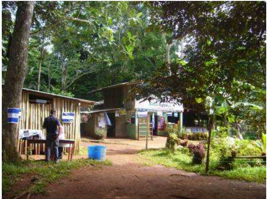
Blick auf die Schule

Diese Schule besteht nun seit zehn Jahren und wird von Schülerinnen und Schülern im Grundschul- und im Sekundarstufenalter besucht.